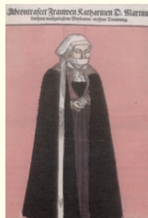
Katharina von Bora als Witwe