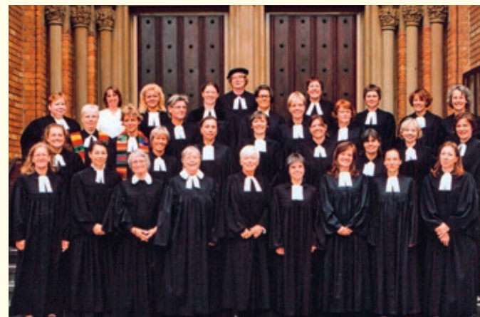
Evangelische Pastorinnen, Bonn