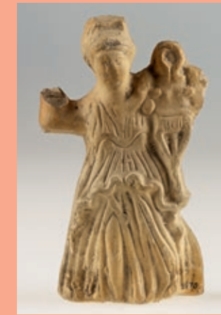
Abb. Venus / Viktoria, Leihgaben LVR-LandesMuseum Bonn