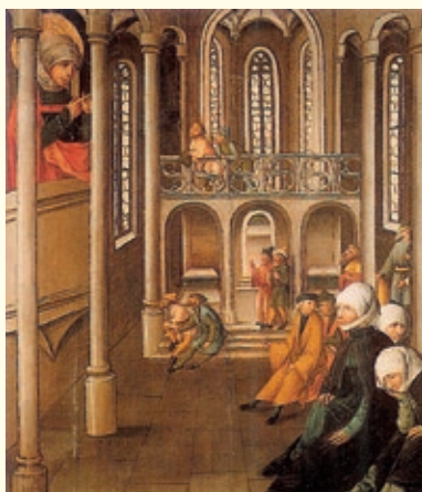
Maria Magdalena predigt in Aix en Provence