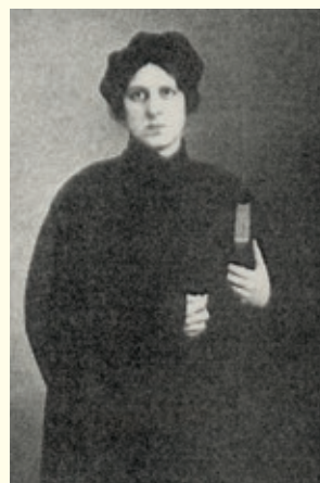
Regina Jonas, Rabbinerin