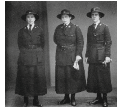
Kölner Wohlfahrtspolizei zwischen 1923 und 1925.

Wir stellen eine Reihe Pionierinnen aus unterschiedlichen Branchen und Zeiten vor. Sie demonstrieren, dass es immer Frauen gab, die innovative Wege gingen, eine Firma gründeten oder in Männerdomänen erfolgreich waren. Wir brauchen solche Vorbilder.