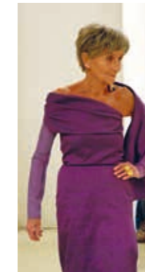
Herta Gebhart Modenschau 2009