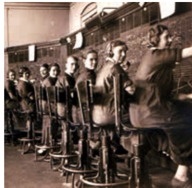
Ortschaft Bielefeld 1936

Keine Ausbildung, niedriger Lohn und kaum Aufstiegschancen kennzeichneten die Arbeit sowohl der deutschen Frauen wie auch der Gastarbeiterinnen, die ab 1960 als flexibel einsetzbare Arbeitskräfte kamen. Eine Reihe von Frauenstreiks trug dazu bei, die Arbeitssituation zu verbessern.