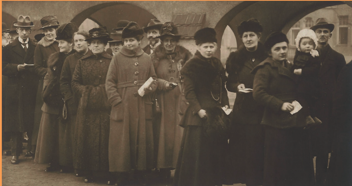
Warteschlange vor einem Wahllokal zur Wahl der Nationalversammlung 1919