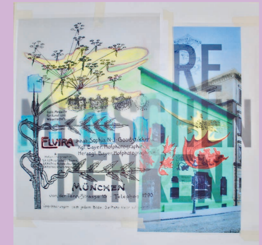
Fotoatelier Elvira, Collage v. Corinna Heumann 2018